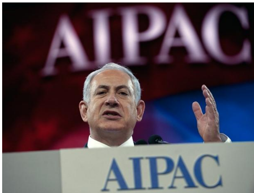
AIPAC je postao najsnažniji strani lobi u SAD-u

im je serviran kao „autonomija skupljanja vlastitih otpadaka i ubijanja vlastitih komaraca”.